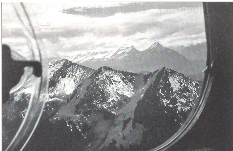
Berge, wohin man schaut.

man früher mühsam und mit wenig Begeisterung marschierte. Das Justistal ist eine in sich geschlossene sehr schöne Landschaft mit vielseitiger Flora und Fauna. Mit ein wenig Glück sieht man Steinböcke, genau hinter den Felsen, wo wir jetzt neben der grossen Antenne auf dem Niederhorn in der Luft um die Ecke biegen. Der Wanderweg durchs Justistal hinauf ist im hinteren Teil auch bereits verschneit, aber man sieht ihn noch gut. Über den kleinen Pass Sichle geht es in die nächste Geländekammer – es gibt keinen besseren Ausblick – rechts von uns türmen sich die schroffen und abweisenden Felsen der Bergkette Sieben Hengste auf.