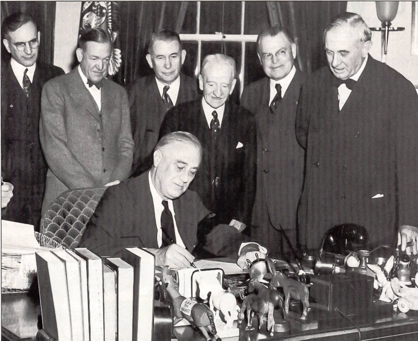
Einem Tag nach dem Überfall auf Pearl Harbor, am 8. Dezember 1941, unterzeichnete Präsident Franklin D. Roosevelt im Weissen Haus in Washington D.C. im Beisein von Mitgliedern des Kongresses die Kriegserklärung an Japan.

Die Besatzung war besonders beeindruckt vom erfolgreichen Überraschungsangriff der Briten im November 1940 mit 21 Swordfish-Torpedoflugzeugen vom Flugzeugträger HMS Illustrious auf den gut gesicherten italienischen Hafen von Tarent. Bei diesem waren sieben Schiffe, darunter drei Schlachtschiffe, schwer beschädigt worden. Tarent war im Ansatz durchaus mit Pearl Harbor vergleichbar (nur eine enge Ausfahrt, flache Gewässer). Zum Studium dieses Angriffs und der Auswirkungen war extra ein japanischer Marineattaché aus Berlin nach Tarent gereist.