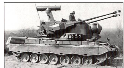
Gepard (D)/CA 1 (NED)