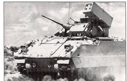
Bradley Linebaker (USA)

Im kommenden Quiz werden die folgenden Fliegerabwehrpanzer behandelt: