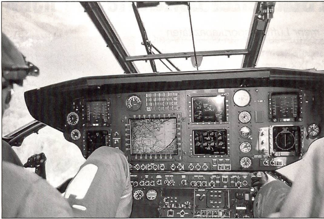
Bildschirme dominieren das Cockpit des neuen Cougars. Cougar = Kuguar, ein anderes Wort für Puma, das aus dem Indianischen stammt.

Bildschirme das Blickfeld. Da sind einmal je zwei Flugüberwachungsinstrumente, die den konventionellen Fluglagehorizont sowie den HSI ersetzen. Der Primary Flight Display (PFD) beinhaltet unter anderem auch die Informationen über Geschwindigkeit, Steig- und Sinkgeschwindigkeiten, Fluglage sowie die barometrische Höhe und die Radarhöhe.