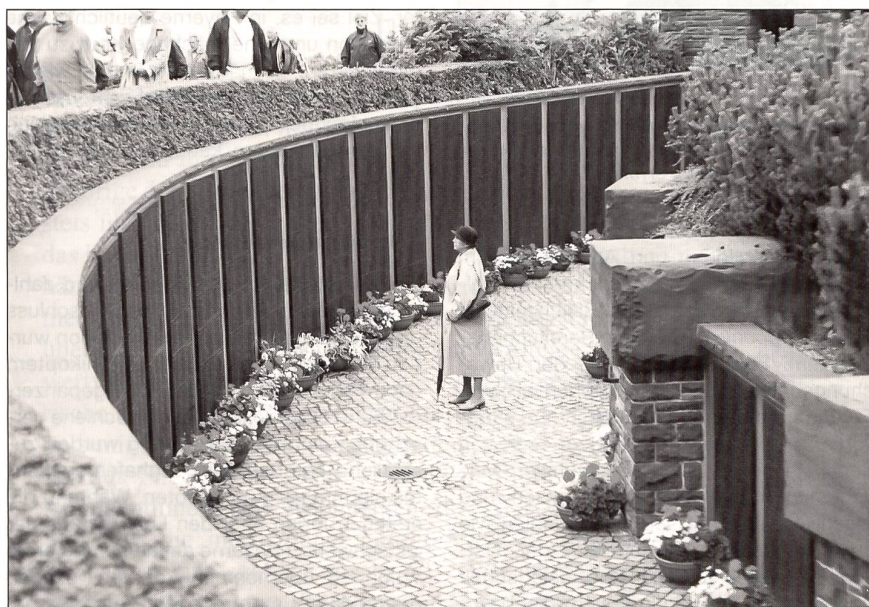
Das Ehrenmal in Kiel-Mölnort dokumentiert auf Bronzetafeln die Namen von rund 34 000 gefallenen deutschen U-Boot-Fahrern beider Weltkriege.