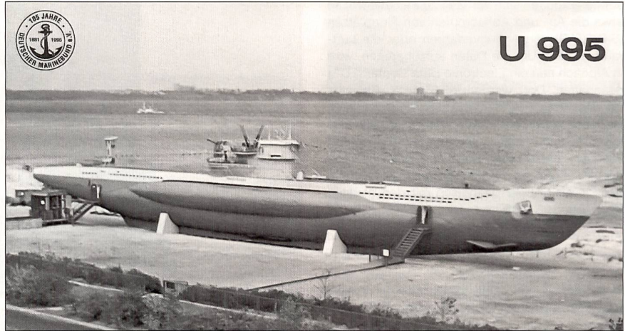
U 995 liegt heute als technisches Museum am Ostufer der Kieler Förde in Laboe.

U 995 war ein Hochseetauchboot vom Typ VII C. Am 22. Juli 1943 bei Blohm & Voss in Hamburg vom Stapel gelaufen, hatte es Ende April folgenden Jahres von Kiel aus die erste Feindfahrt ins Nordmeer angetreten. Heimathafen wurde Narvik. Es folgten Einsätze an der Murmanküste. Hauptaufgabe von U 995 war, den von und nach der Sowjetunion laufenden alliierten Geleitzügen aufzulauern. Zunehmend ungünstiger werdender Kampfbedingungen zum Trotz blieben Erfolge nicht aus. Zum Zeitpunkt der Kapitulation der deutschen Wehrmacht, am 8. Mai 1945, befand sich