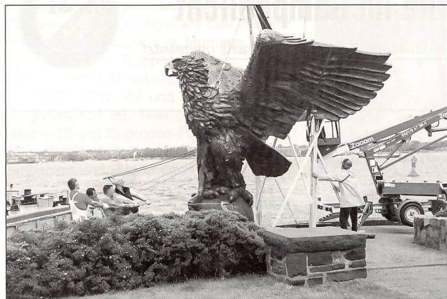
4,5 Meter Höhe, 4,8 Meter Flügelspannweite und 5 Tonnen Gewicht. Ein Schwimmkran hievt den neuen Adler des U-Boot-Ehrenmals in Kiel-Mölnort an Land.

he dem alliierten Bildersturm zum Opfer gefallen. Die der Förde zugewandte Front des U-Boot-Ehrenmals wird überragt von einer haushohen Quadersäule. Sie zeigt das kaiserliche U-Boot-Kriegsabzeichen und ist gekrönt von einer gewaltigen Adlerfigur. Ein in die Erde eingelassener Rundgang dokumentiert auf Bronzetafeln die Namen der rund 34 000 gefallenen U-Boot-Fahrer beider Weltkriege. Allein in den Jahren 1939 bis 1945 blieben 28 751 Mann vor dem Feind – das sind rund 80 Prozent. Das aus den 1930er-Jahren stammende Ehrenmal steht unter Denkmalschutz. Und so wurde im Sommer vergangenen Jahres der nicht mehr standsichere Adler durch eine exakte Kopie ersetzt. «Stimme & Weg» (Nr. 4/2001), die Zeitschrift des in Kassel domizilierten, zurzeit in Osteuropa sehr aktiven Volksbundes Deutsche Kriegsgräberfürsorge (VDK), berichtete über das in Schleswig-Holstein vielbeachtete Ereignis: «4,50 Meter hoch – 4,80 Meter Flügelspannweite – 5 Tonnen