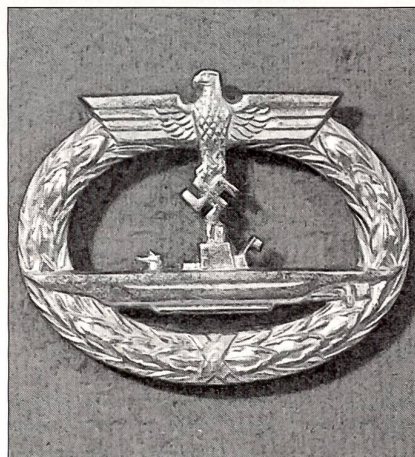
Das U-Boot-Kriegsabzeichen wurde am 13. Oktober 1939 gestiftet.