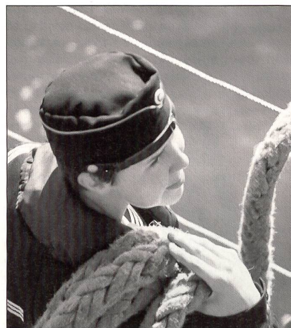
Schiff ahoi, ein weiblicher Matrose bei der Arbeit.

Nach der militärischen Ausbildung können Frauen wie Männer in den Aktivdienst eingezogen werden, wenn die militärische Bedrohung dies erfordert. Alle bleiben bis zu dem Jahr in der Reserve eingeteilt, in dem sie das 60. Altersjahr erreichen.