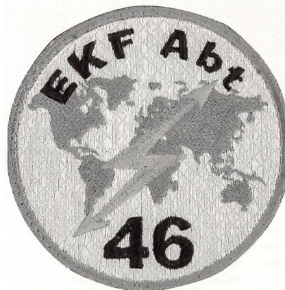
Der Badge der EKF Abt 46 (Elektronische Kriegführung) hat eine silbrige Grundfarbe und zeigt eine dunkelgraue Weltkarte. Das Symbol der Übermittler, der gezackte Pfeil, ist in Gold/gelb gehalten, der Schriftzug ist schwarz.

Vom «Radio Hill» aus, ein Hügel mitten im Ausstellungsgelände, versehen mit vielen Richt- und Rundstrahlantennen, konnten die Besucher alle modernen Kommunikationssysteme der Armee im Einsatz sehen.