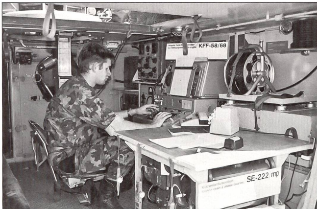
Kurzwellenfunkstation SE 222/mp im Schützenpanzer M119 eingebaut.