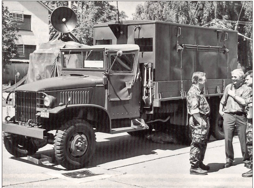
Fachsimpeln vor GMC 6x6 mit Funkaufbau.

Das Motto der Comm 01 hiess «Gestern – heute – morgen» und widerspiegelt die inhaltliche Gewichtung der drei Ausstellungsteile. Vor 50 Jahren, 1951, wurden die Übermittlungstruppen aus den Genietruppen herausgelöst und als selbstständige