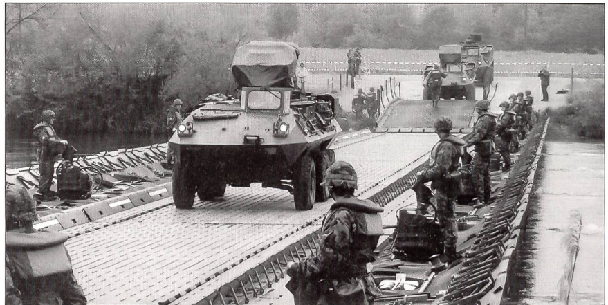
Bereits nach einer Stunde rollten die Fahrzeuge über die Brücke.