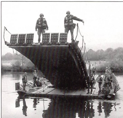
Die halbe Brücke ist bereits fertig.