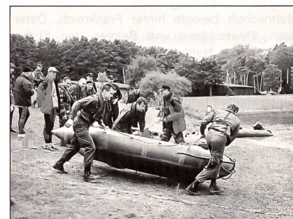
Start zur Schlauchbootfahrt.

Die CISM-Hindernisbahn im König-Baudoin-Stadion war sehr schwierig. Dies zeigte sich an