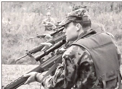
Ausbildung am Stgw 90 mit Zielfernrohr.

erforderte, musste in jeder Patrouille mindestens ein Einheimischer mitmischen. Es wurden also immer ein Gast und einer aus dem Reiat in ein Team eingeteilt.