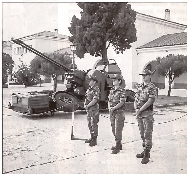
Dreifache Frauenpower neben dem Geschütz.

Am nächsten Morgen ging es dann los. Die Fahrt führte uns zum spanischen Verteidigungsministerium. Anlässlich des dortigen Gesprächs merkten wir rasch, dass wir einen spannenden Zeitpunkt für unseren Spanienbesuch ausgewählt hatten: Auf Anfang 2002 wechselt die spanische Armee nämlich zu einer reinen Berufsarmee über. Waren bis anhin nur Offiziere und Unteroffiziere Berufssoldaten, werden es ab nächstem Jahr alle Mannschaftsgrade