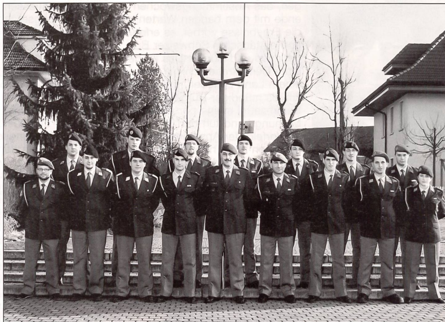
Vor der Brevetierung zum Feldweibel noch schnell ein Klassenbild.

einen gut 20-jährigen Unteroffizier zu den grössten Herausforderungen in unserer Armee. Mit zunehmender Komplexität der militärischen Ausbildung steigen auch die Anforderungen an den Feldweibel. Er muss sich in kurzer Zeit eine Vielzahl von Detail- und Fachkenntnissen aneignen und hat Führungsaufgaben mit über 100 Untergebenen zu bewältigen, wie sie im Zivilleben auch heute noch nicht anzutreffen sind. Die dabei gefragte Menschenkenntnis lässt sich mit keiner Theorie vermitteln, sondern nur in praktischer Erfahrung.