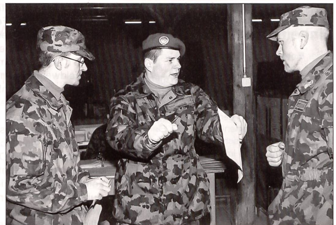
Konstruktive Zusammenarbeit zwischen Feldweibel und Gruppenführern.

Der Blick nach vorne: Das Leitbild für die Armee XXI mit seiner Umorganisation der