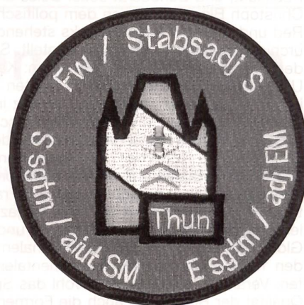
Badge der Fw Schule 1996–2000.

Das Schwergewicht in der Feldweibelbildung liegt heute in der Führungsausbildung und Persönlichkeitsschulung. Das Kommando Feldweibel- und Stabsadjutanten-Schulen besteht seit 1952. Die ersten Feldweibel wurden in St. Gallen und Herisau ausgebildet, ehe das Kommando 1953 nach Thun verlegt wurde. Jährlich werden in Thun über 300 Einheitsfeldweibel ausgebildet. Neben den Einheitsfeldweibeln werden jährlich in einem einwöchigen Technischen Lehrgang (TLG) rund 40 Einheitsfeldweibel zu Adjutant-Unteroffizieren (Bataillons-/Abteilungsfähnliche) ausgebildet. Weitere rund 60 Feldweibel/Adjutant-Unteroffiziere bestehen zudem einen dreiwöchigen Technischen Lehrgang, ehe sie im Armee-Aus-