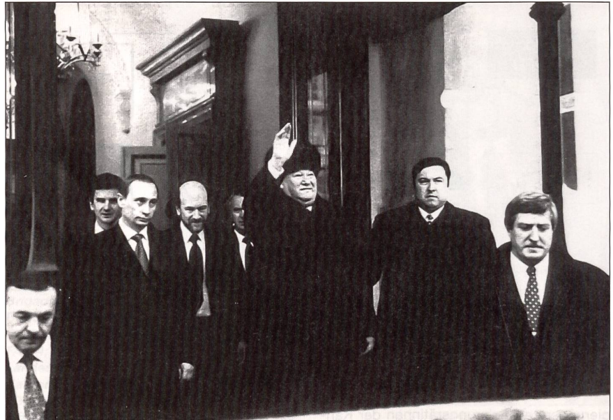
Machtübergabe an Regierungschef Wladimir Putin nach der Rücktrittserklärung am 31. Dezember 1999 im Kreml.

stärker über die Zeit nach Jelzin nachzudenken. Sie hatten lange das Augenmerk auf Lebed gerichtet. Er besass Ausstrahlung, verfügte sowohl in der Bevölkerung als auch in der Armee über eine grosse Popularität. Lebed war ein Mann der Ordnung. Aber jetzt war dieser für die «Familie» ausgeschieden. Jelzin selbst widmet in seinem dritten Buch ein ganzes Kapitel dem Thema Generäle. Jelzin studiert die Biografien berühmter Feldherren. Er vertieft sich in die Geschichte. Denn er glaubt, dass dieses riesige Reich Russland von einem Hauptproblem geschüttelt wird: Es krankt an mangelnder Ordnung. Die Gesetze werden zu sehr verletzt, Schlendrian und Trunksucht sind eine Geissel der Menschen. Und Jelzin hat am eigenen Leib erfahren, wovon er spricht. Er bewegt sich, so gesteht er selbst, ständig mindestens am Rand der Trunksucht. Bestechlichkeit und Unehrllichkeit plagten das Land. «Ich begann», schreibt der Präsident, «über die Generäle nachzudenken.» Aber sein Befund ist niederschmetternd: «Ich lernte den General ohne Überzeugung kennen.» Und einmal mehr ruft Jelzin pathetisch aus: «Wie viele bescheidene, gebildete Zivilis-