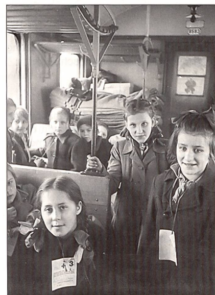
Ein Zug voll mit österreichischen Kindern wird betreut und ans Reiseziel begleitet.