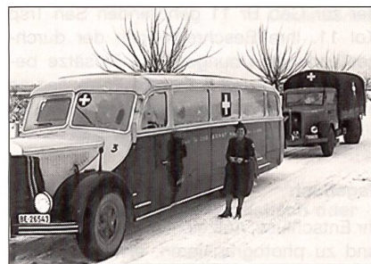
Marion van Laer reist mit einem Schweizer Autocar im Auftrag des Roten Kreuzes nach Polen.