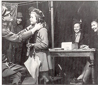
Kinder werden eingekleidet.

* M. van Laer-Uhlmann: Weisses Kreuz und Rotes Kreuz ISBN 3-909149-59-6, 350 Bilder, Walter Verlag, Postfach 121, 8706 Meilen, info@walter-verlag.ch Fax: 01 923 80 89, Tel.: 01 923 31 77 Fr. 48.–