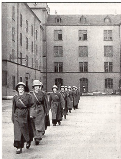
Das Einüben der militärischen Formen gehörte auch zum «Alltag».

fahrerinnen zur Verfügung zu halten und damit Wehrmänner für die kombattanten Truppen freizustellen. Die Autorin nahm am ersten organisierten Einführungskurs teil und beschreibt ihre Ausbildung, Zugschule, Grüssen, Marschieren – das stellten die Ausbildner allem voran, von den Frauen quitiert mit Schmunzeln, auf die Zähne Beissen und mit Humor.