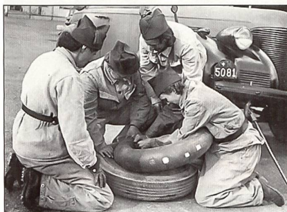
Auch Pneuwechsel will gelernt sein, mit vereinten Kräften gehts besser!