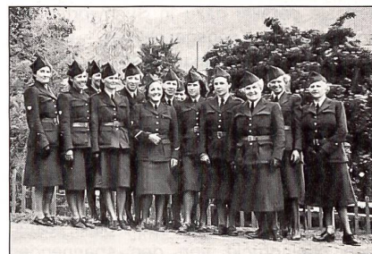
FHDs der ersten Stunde zum Gruppenbild versammelt.