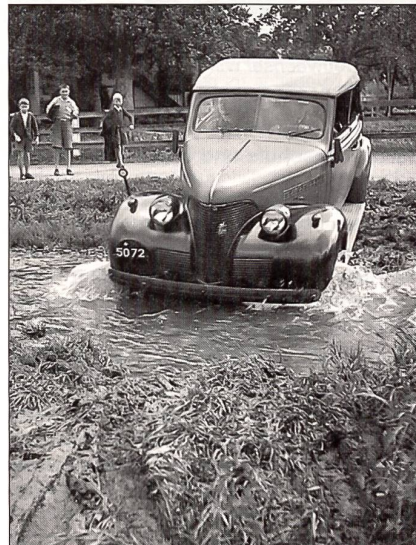
Als Fahrerin durfte man in keiner Situation klein beigeben, darum war auch das Überqueren des Baches kein Problem.