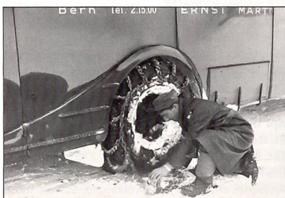
Kettenmontage war angesagt.