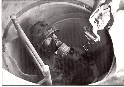
Eng ists da drunten bei den Spinnen!

Meine Besuchsrunde geht wieder ins Rhonetal hinunter. Hier treffe ich auf ein gemütliches Biwak. Die Rekruten haben da übernachtet und waren auf Piktett. Sie lassen sich gerade ein gutes, heisses Mittagessen aus den Kochkisten schmecken, mitten in einem Weinberg. Sie sind in der Duchhalteübung über mehrere Tage. Wenig Schlaf, viel Einsatz. Aber keiner schlurft oder motzt, die Motivation ist immer noch hoch. In kleinen Gruppen geht es nun darum, ein Sprengobjekt für die Sprengung vorzubereiten und – supponiert natürlich – zu sprengen. Hier treffe ich einen der jungen Leutnants, die im Frühling brevetiert wurden. Er fühlt sich wohl in seiner Einheit, wo er seinen Grad abverdient. Hier laufe etwas, das sei ein lebendiger Einsatz und Umsetzung des in der OS Gelernten. Ein fröhlicher, junger Tessiner Instruktor erklärt mir alles sehr genau. Ich steige mit ins Sprengobjekt ein. Worauf habe ich mich da eingelassen? Diese steilen und hohen Treppen und ich mit meinen untrainierten, kurzen Beinen! Es gibt kein Zurück, wer A sagt, muss auch B sagen. Es ist ungeheuer spannend. Endlich ist wieder ein Lichtschein zu sehen. Die Sprengobjekte in der Schweiz sind auch in Friedenszeiten geladen. Im Ernstfall wird nur noch der Zünder angebracht, nach einem sehr komplizierten Schema, damit keine zufälligen Fehler passieren. Die Unterlagen dazu sind GEHEIM klassifiziert. Jeder Rekrut der Festungspioniere muss jeden Arbeitsschritt