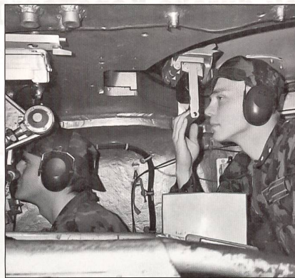
Richter und Beobachter an der Arbeit.

Einige Wochen später besuchte ich die Jüngsten der Festungstruppen: die Festungsrekruitenschule 258, die in Sion beheimatet ist. Sie sind im Simplongebiet in