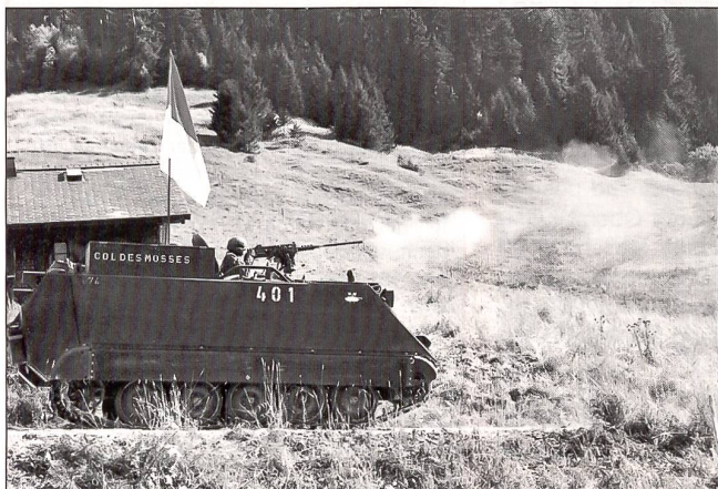
Schützenpanzer im Einsatz, Übung im Gelände, Aufbrechen einer Sperre.

Eine andere Gruppe besucht die Ausbildung am Schiesssimulator. Hier geht alles vollelektronisch, geräuschlos, umweltfreundlich. Auf dem PC-Bildschirm läuft ein Programm ab, der Gegner muss erkannt und vernichtet werden. Ein Rekrut