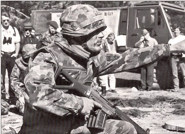
Durchspielen der Übung mit Befehlen ohne Waffeneinsatz.