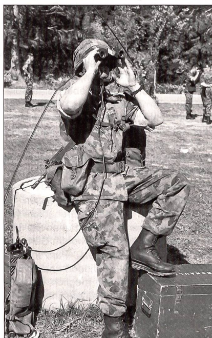
Aufmerksamer Beobachter und Funker.

lässt sich einer fallen, der Kamerad ist gefordert, ihn sofort zu bergen. Einer gibt Feuerschutz, der andere zieht den Verletzten aus der Feuerlinie, trägt ihn davon, wie man es im Sanitätsdienst Fach Kameradenhilfe lernt. Lang überlegt und diskutiert wird nicht, welches nun die richtige Lagerung oder Tragart sei. Kräftige Kerle, diese Rekruten, schultern einen ebenso schweren Kameraden einfach, als wärs ein Kartoffelsack. Die Rekruten sind mit Leib und Seele dabei. Die Szene ist realistisch. «Aaah, je souffre!» (ich leide!) brüllt einer und der andere: «Ta gueule, c'est la guerre!» (Schnauze, wir sind im Krieg!). In wenigen Minuten ist die Übung beendet, der Spuk vorbei. Jetzt kommt die Besprechung. Wo wurden Fehler gemacht, welche und wie sind sie beim nächsten Durchgang zu vermeiden und das Verhalten zu verbessern? Und jetzt das Ganze noch