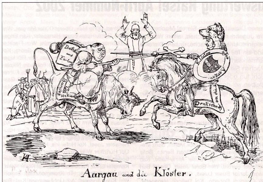
Zeitgenössische Karikatur des Klosterstreites im Aargau 1841