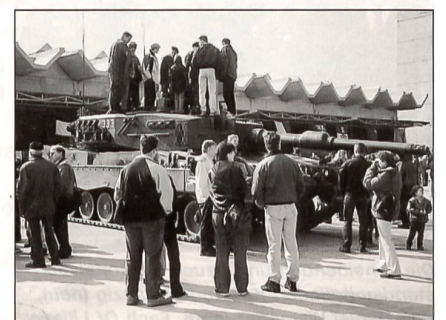
Nach den Vorführungen wurde der Leopard-Panzer gestürmt und das Innenleben erkundet.