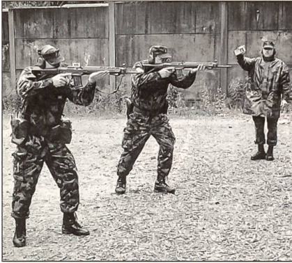
Eine solide NGST-Ausbildung bildet die Grundlage für die Kurse «Stgw 90 mit Zielfernrohr».

wird. Die primäre Mission eines Scharfschützen ist die Bekämpfung von definierten Zielen aus getarnten Stellungen heraus. Er führt Kampfaufträge gegen Ziele auf grössere Distanzen (bis 800 m) aus. Im Gegensatz zum Sturmgewehrschiessen mit Zielfernrohr, über welchen die Schweizer Armee im Zugtrupp bzw. in der Kommandogruppe verfügt, kommt der Scharfschütze erst auf Kompanie- und/oder Bataillonsstufe zum Einsatz.