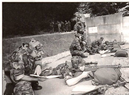
Scharfschützenteams beim schulmässigen Schiessen.

Der vom UOV Dachs durchgeführte Kurs «Sturmgewehr 90 mit Zielfernrohr» besteht aus zwei Teilen. Im ersten Teil wird das Schiessen mit dem Zielfernrohr auf verschiedene Distanzen geschult. Weiter werden mögliche Techniken der Tarnung, der Distanzermittlung und der Rapportierung vermittelt. Basis für diesen Kurs ist die