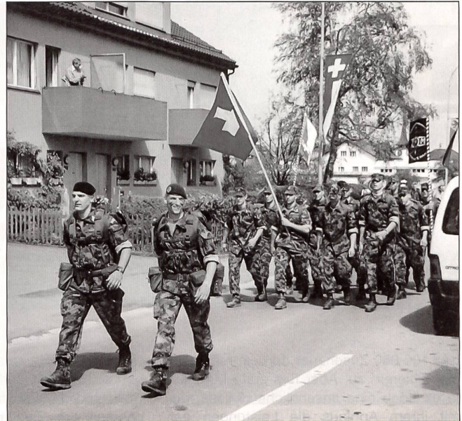
Britische und schweizerische Marschdelegation beim Vorbeimarsch.