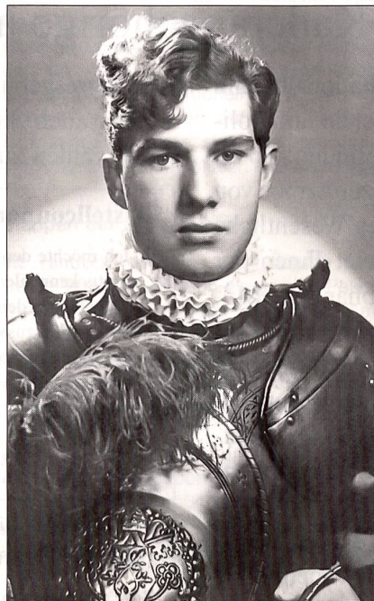
Schweizergardist J. R. fand 1957 in der französischen Fremdenlegion einen tragischen Tod.

hatte sich die Schwächung der zu dieser Zeit etwa 25 000 Mann starken Legion zum Ziel gesetzt. Allein via Marokko, so berichtete der «Spiegel» weiter, seien seit 1957 2814 Deserteure heimgeschafft worden, nämlich «1952 Deutsche, 443 Spanier, 397 Italiener, 53 Ungarn, 39 Jugoslawen, 34 Belgier, 32 Schweizer, 27 Österreicher, 17 Holländer ...».