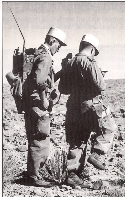
1950er-Jahre – Funktrupp der Fremdenlegion in Nordafrika.