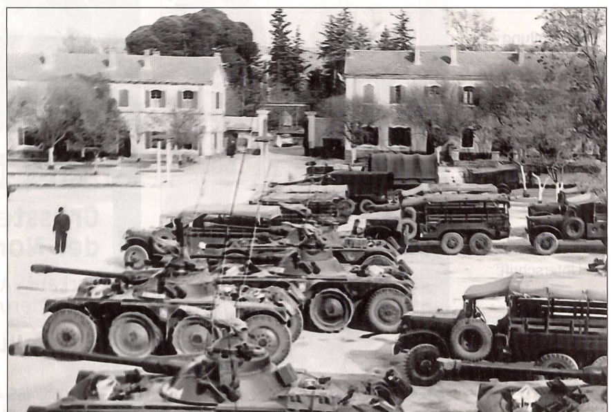
Sommer 1961 – Blick in das Kasernenareal von Saïda, mit Fahrzeugen des 1. Fremden-Kavallerie-Regiments. Vordem war Saïda infanteristisches Grundausbildungszentrum der Legion.