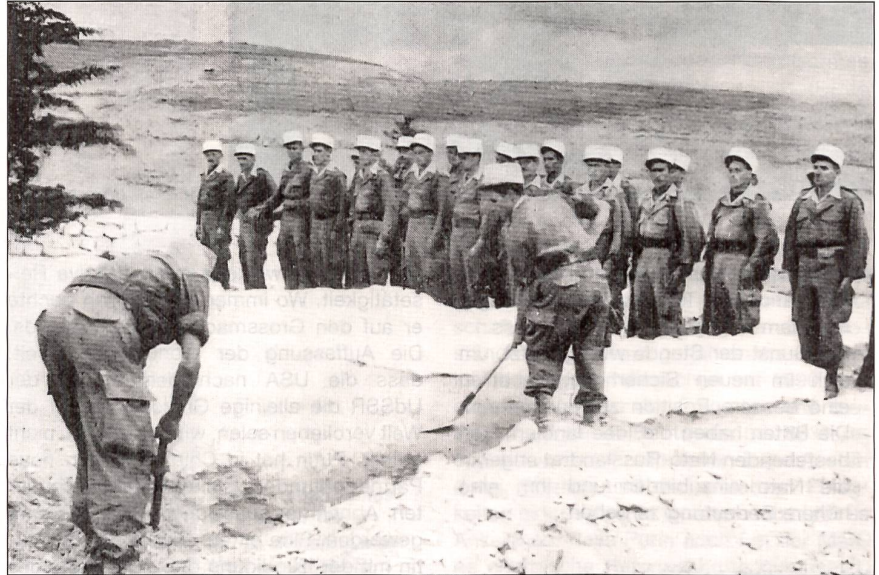
1950er-Jahre – Legionärsbegräbnis in Nordafrika.

Der Generalkonsul sprach hier ein Problem an, das die französische Fremdenlegion seit Jahren beschäftigte: Die Massendesection insbesondere junger Soldaten. Der deutsche «Spiegel» sprach am 2. September 1959 von bislang 3000 Deserteuren und berief sich dabei auf Informationen des «Rückführungsdienstes für Fremdenlegionäre». Diese in Tetouan (Marokko) domizilierte Organisation der algerischen provisorischen Regierung arbeitete eng mit der Befreiungsarmee zusammen und