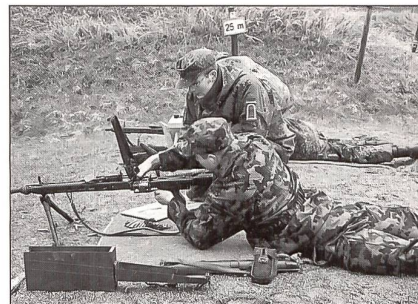
Instruktion durch deutschen Unteroffizier am Maschinengewehr.

Silber oder Bronze zu schiessen. Mit dem bei der Bundeswehr neu eingeführten Sturmgewehr G36, der Pistole P1 und dem Maschinengewehr MG3 galt es die für die Auszeichnung nötige Punktzahl zu schiessen. An fremden Waffen haben wir Treffsicherheit bewiesen. Drei Schützenschnüre in Gold und drei in Silber konnten an die KUOV-Delegation verliehen werden. Dies entspricht einer Erfolgsquote von 60 Prozent. Die Auszeichnungen und Diplome wurden durch den Kompaniechef persönlich vor versammelter Mannschaft überreicht.