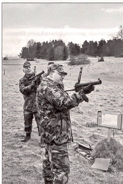
Üben der richtigen Manipulation am Granatwerfer.

Wir hatten die Gelegenheit erhalten, das Programm zum Erwerb der Schützenschnur in Gold,