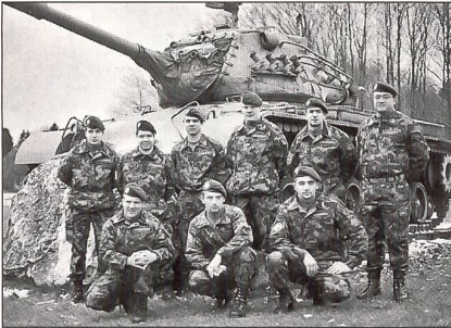
Die KUOV-Delegation in Stetten.