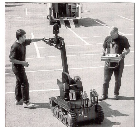
Roboter «Theodor» wird zum Einsatz vorbereitet. Der Beamte (links) lädt die Sprengvorrichtung, während der andere Beamte die tragbare Steuervorrichtung kontrolliert. Im Hintergrund das Einsatzfahrzeug.

Nach der Theorie wurde gezeigt, wie hilfreich der BEX-«Mitarbeiter» «Theodor» bei Bombendrohungen ist. Mittels Fernsteuerung wurde der High-Tech-Roboter aus dem geparkten Einsatzwagen gefahren. «Theodor» verfügt über eine Videokamera, welche Detailaufnahmen von