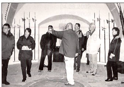
In der Waffenkammer des Munots.