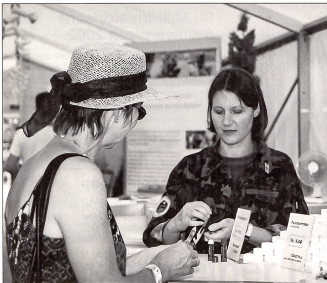
Die Verkaufsartikel am FdA-Stand finden regen Zuspruch.