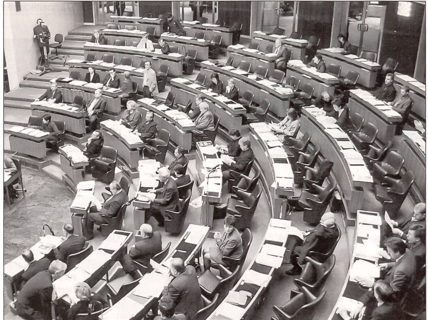
Plenum des Nationalrates.

Der österreichische Nationalrat hat deshalb am 12. Dezember des Vorjahres einen Expertenbericht des Landesverteidigungsausschusses als Analyseteil und eine Entschliessung mit Empfehlungen an die Bun-