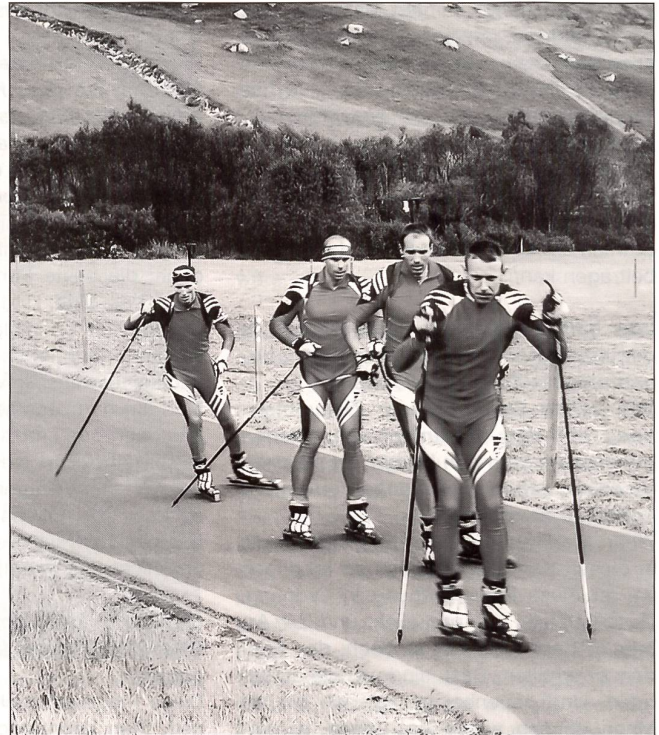
Das Schweizer Biathlon-Nationalteam demonstrierte sein Können.