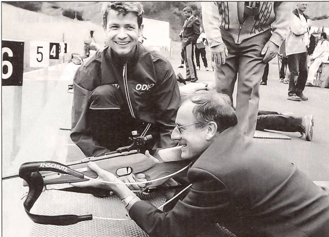
Korpskommandant Beat Fischer wird instruiert von Olympiasieger Ole Einar Bjordalen.

neuen Rollskibahn inskünftig ihr Trainingspensum professionell absolvieren. Der 50-m-Biathlon-Kleinkaliberstand, welcher mit zehn elektronischen Scheiben ausgerüstet ist, sowie die dazugehörige Luftgewehr-anlage (10-m-Anlage), können nun im Sommer und auch im Winter zu Trainings- und Wettkampfwegen benutzt werden. Die Verteil- und Steuerungszentrale befindet sich im «Stal» Flesch, der zweckmässig umgebaut wurde mit einer sanften Aussenrenovation und innen auf die Bedürfnisse der Betreiberorganisation ausgebaut ist. Die Laufstrecke West sowie die Schiessanlage sind mit einer Beleuchtung ausgestattet.