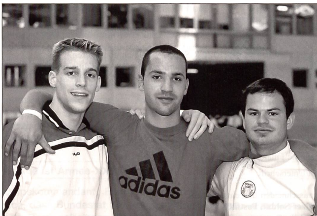
Das Schweizer Team.