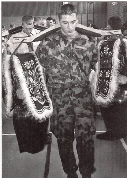
Konzentrierte Demonstration im Treichelschwingen.

Amport macht die Veterinärrekrutenschule im Raume Bern (Sand). Zweimal pro RS ist er in Luziensteig zu Gast und überprüft und ersetzt, wenn nötig, fachmännisch und gewissenhaft die Hufeisen der Pferde (Hufeisen mit vier Stollen). Auch der Veterinär