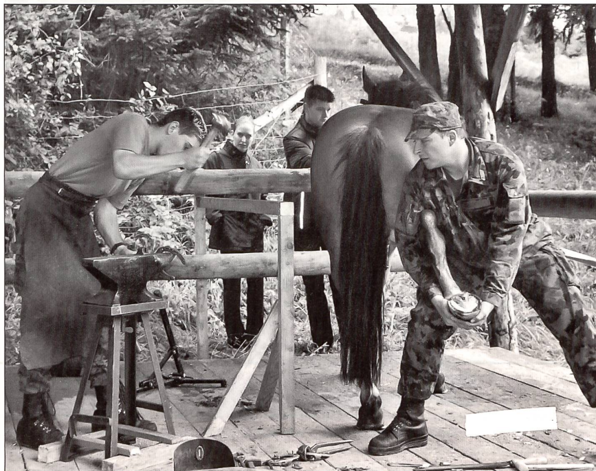
Feldschmiede in Aktion.