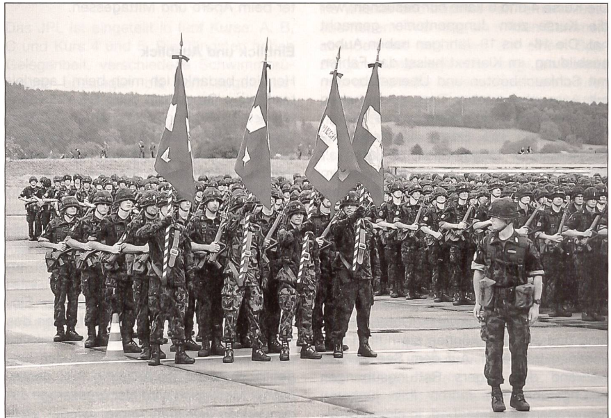
«Fahnenwache vorwärts, Marsch!»

Der Regimentskommandant wies in seiner Ansprache an die Wehrmänner und geladenen Gäste darauf hin, dass durch das Leisten des obligatorischen Wehrdienstes ein erheblicher Beitrag an die Gemeinschaft geleistet wurde. Darin zeigt sich ein Teil der Mitverantwortung für unseren Staat. Diese Verantwortung kann auch in Zukunft nur mit einer tief verwurzelten Mi-