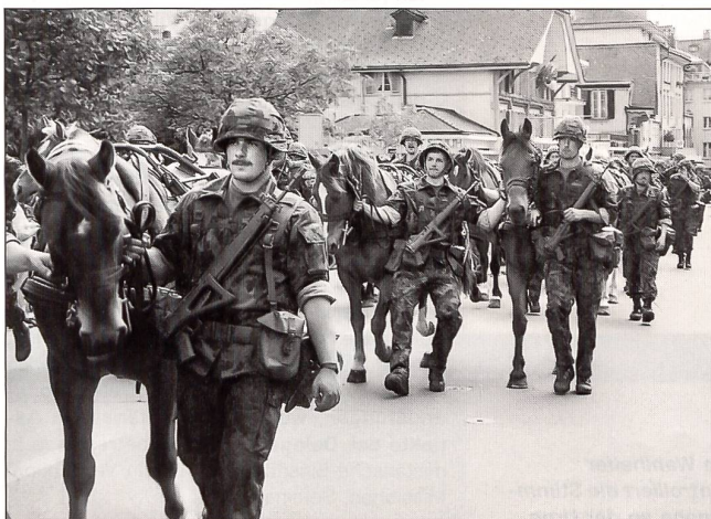
Mit 60 Pferden defilierte der Train noch einmal vor ihrem Kdt und der sehr grossen Zuschauerkulisse.