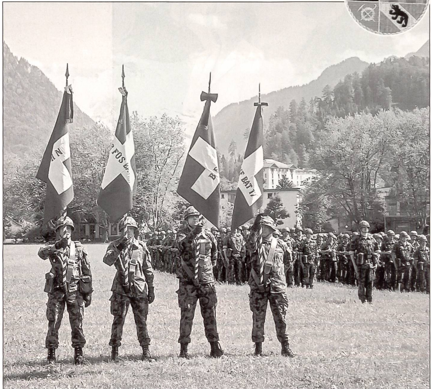
Stolz präsentieren die Fähnriche zum letzten Mal ihre Bataillonsfahnen.

Eine sehr grosse Zuschauerkulisse, worunter auch viele ausländische Gäste waren, verfolgte den disziplinierten Aufmarsch des Regimentes. Unter den zahlreichen Gästen war auch der Kommandant