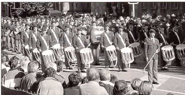
Um die 30 000 Zuschauer sahen den traditionellen Umzug am «Fête des Vendanges»