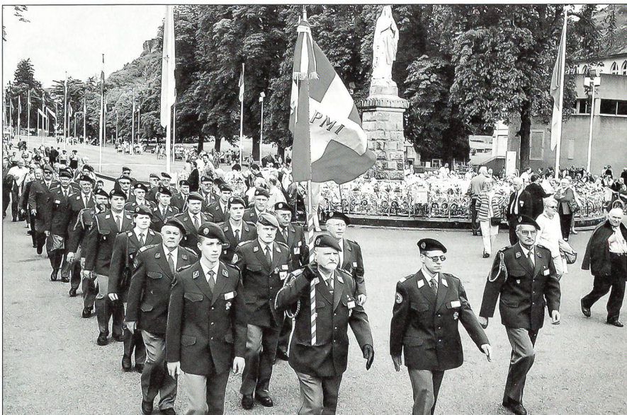
Aufmarsch der Schweizer Delegation zu den offiziellen Veranstaltungen.

Die Schweizer Delegation reiste per Zug oder Flugzeug aus allen Teilen des Landes an, um in Lourdes gemeinsam mit den