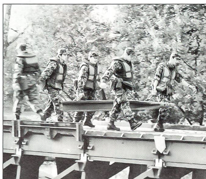
Beim Bau der Festen Brücke 69

len unsere Leute am Schluss der RS gesund nach Hause entlassen!» Nach dem Vorbeimarsch der vier Kompanien ging es dann nichts wie los zu den verschiedenen Arbeitsplätzen. Und da kamen dann die Zivilisten – allen voran die Freundinnen und die Eltern der Rekruten – ob dem «was die schon alles können» – aus dem Staunen kaum mehr heraus. Ob im Bataillonskommandoposten der Stabskompanie, beim Gleis- und Fahrleitungsbau der «Eisenbahner», bei den Rammponktionieren, den Brückenbauern oder bei den Baumaschinenführern, Motorfahrern und wie die Spezialisten alle heissen: Was man da zu sehen bekam, verdient Applaus. Das gilt auch für das Showkochen von jenem Rekrut der Stabs-Kp, der feine runde Schenkeli (mmmhh!!) machte, und für die Ticinesi, die in einer lustigen «Sfilata di Moda» die ganze Tenü-Kollektion der jungen Genisten präsentierten.