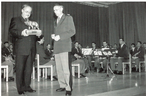
Der geschnitzte Bär aus Bern, überreicht von Bundesrat Samuel Schmid.