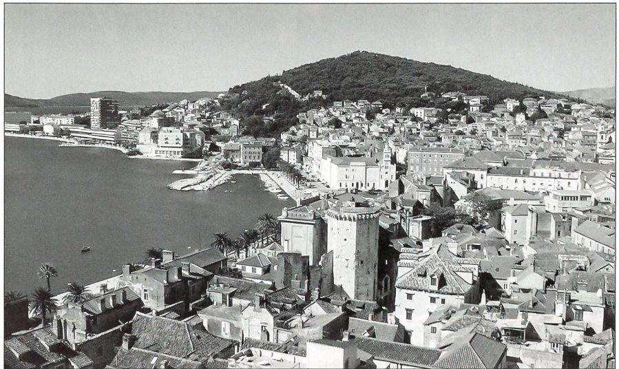
Blick auf den Hafen von Split und die Altstadt

Die Schweizer Delegation mit dem Schatzmeister der EMPA, Jean-Paul Gudit, den Vertretern des «Schweizer Soldats», Wer-