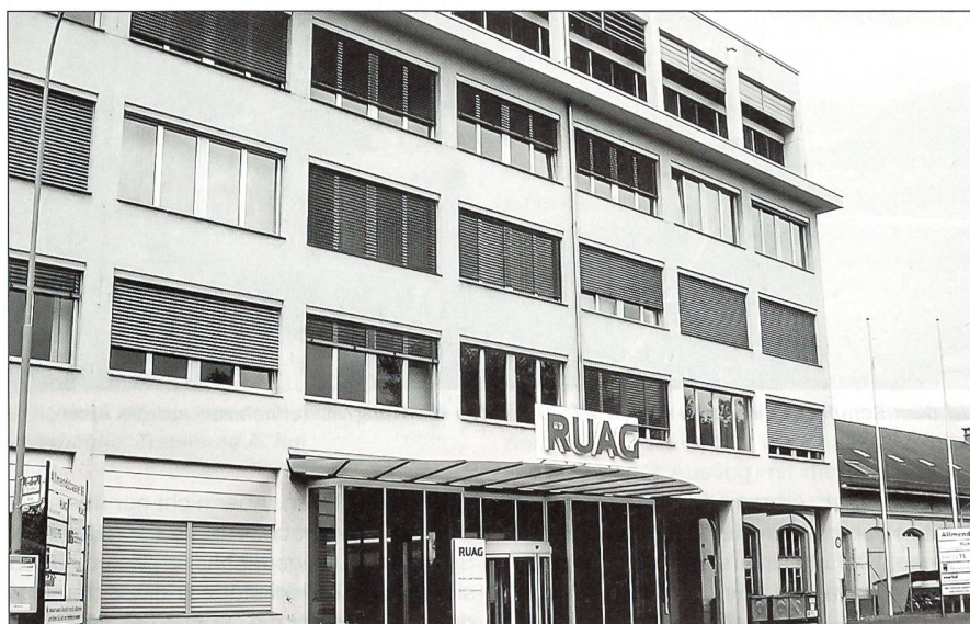
Die RUAG muss sich vermehrt in Zivilmärkten etablieren.

Die Rüstungspolitik des VBS ist auf Wirtschaftlichkeit ausgerichtet. Alle Rüstungsaktivitäten richten sich nach dem Grundsatz des Wettbewerbs und beachten die Vorgaben des öffentlichen Beschaffungswesens des Bundes. Kosten-Nutzen-Überlegungen werden ab Beginn des Evaluationsverfahrens eingebracht. Durch konsequente Anwendung materialwirt-