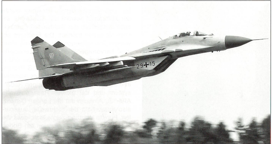
Die deutsche MiG-29 29+15 startet in Dübendorf zu einem Trainingseinsatz.

Die 1. Staffel des JG 73 aus der Norddeutschen Tiefebene Mecklenburg-Vorpommern ermöglichte diese Premiere am Schweizer Himmel mit ihrem Besuch. Die Ausbildungszusammenarbeit mit der deutschen Luftwaffe entspricht den Auslandaktivitäten unserer Luftwaffe und basiert