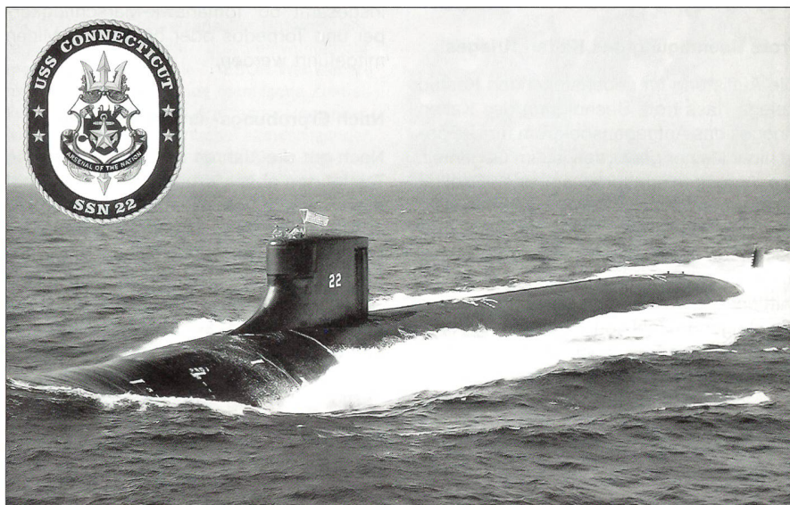
Die «USS Connecticut» (SSN-22), das zweite Boot der Seawolf-Klasse, auf voller Fahrt vor der amerikanischen Ostküste. Das Boot ist der Atlantikflotte zugeteilt und im Stützpunkt von Groton, Connecticut, stationiert (Foto: USN).

Ferner wird überlegt, ob für die Jagd-U-Boote – ähnlich wie bei den ballistischen Lenkwaffen-U-Booten – eine Doppelbesatzung eingeführt werden soll. Kurzfristig wird der Umbau von vier ballistischen Lenkwaffen-U-Booten der Ohio-Klasse zu Trägern für konventionelle Marschflugkörper die Verfügbarkeit von U-Booten generell etwas verbessern, da diese U-Boote auch als normale Jagd-U-Boote eingesetzt werden können. Ebenso wird der Verzicht