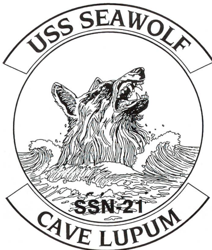
Das Emblem des Leitschiffs der neuesten U-Boot-Klasse der U.S. Navy.

Die Führung des Pentagons hat die neuen Aufgaben zügig erkannt, für die sich U-Boote im neuen Bedrohungsspektrum besonders eignen. Dabei kommen diesen Booten die relativ hohe Geschwindigkeit, die Stealth-Eigenschaften, die grosse Kampfkraft, die geräuscharme Fahrt, die hohe Autonomie und lange Verweilzeit zugute. Die Rolle der ballistischen Lenkwaffen-U-Boote (SSBN) bleibt im Wesentlichen unverändert, obschon vermehrt der Ruf laut wird, solche Boote nicht nur zur nuklearen Abschreckung, sondern auch für den Einsatz von weit reichenden konventionellen Raketen z.B. gegen geheime Produktionsanlagen für Massenvernichtungswaffen vorzusehen. Die Rolle der SSBN erfährt