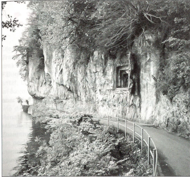
Die Felsimitation vor den Artilleriekanonen lässt sich mit einer Handkurbel herausklappen.

entscheid fiel. Wohl weil dieser Umstand vorhersehbar war, war die Nidwaldner Offiziersgesellschaft bestens gerüstet und legte Ende der 1980er-Jahre mehrere alternative Nutzungsvorschläge auf den Tisch: Die Festung könnte als Lagerunterkunft für Pfadfinder, als Weinkeller oder als Museum genutzt werden. Aus finanziellen Gründen entschloss sich die Offiziersgesellschaft nach einigen Sitzungen schweren Herzens, die Umnutzungspläne aufzugeben.