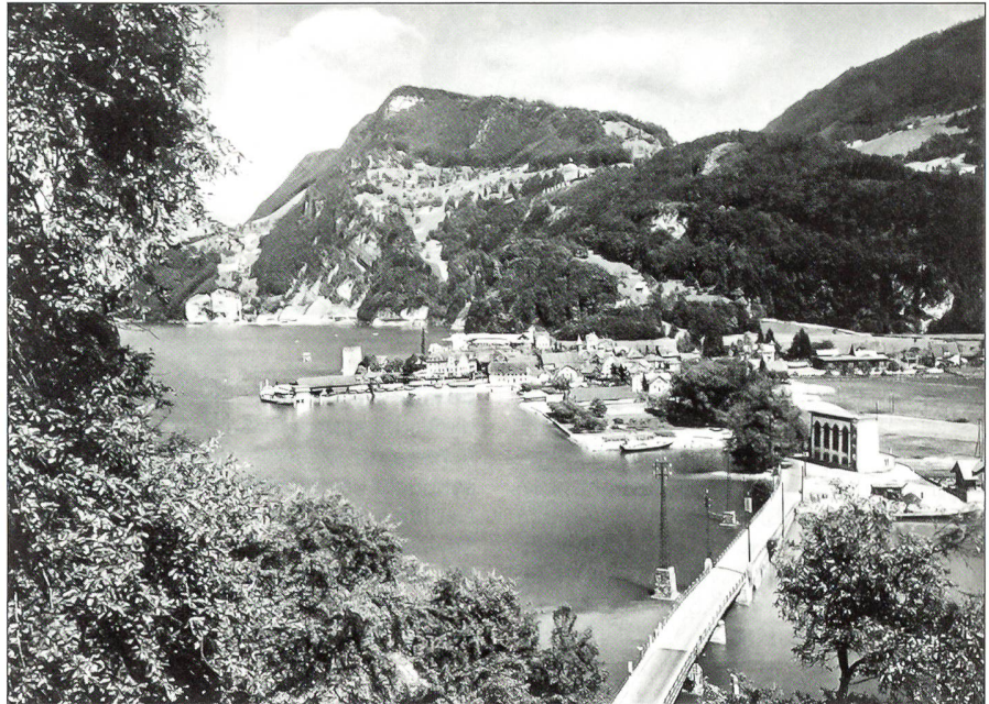
Stansstad zur Zeit des Zweiten Weltkriegs.

Die Festung Fürigen liegt am Vierwaldstättersee, an der Strasse von Stansstad nach Kehrsiten. Sie ist zu Fuss in wenigen Minuten vom Bahnhof Stansstad aus zu erreichen. Die Festung ist eines von vier Häusern des Nidwaldner Museums in Stans, zu dem auch das Salzmagazin (Museum für Kunst), das Höfli (Museum für Geschichte) und das Winkelriedhaus (Museum für Kultur und Brauchtum) gehören. Die Festung ist vom 1. April bis 31. Oktober jeweils samstags und sonntags von 11 bis 17 Uhr geöffnet. Weitere Informationen sind unter www.nidwaldnermuseum.ch oder unter Tel. 041/618 75 14 erhältlich. Auf Anfrage oder für Gruppen lassen sich das ganze Jahr auch Führungen buchen.