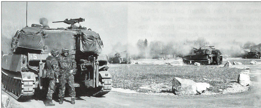
Pz Hb Abt 80 ad hoc

dem Vorbild der A XXI zu bilden und diese als «Task Force 6» in einem operativen Sicherungsauftrag (Gegenkonzentration im Kanton Schaffhausen) einzusetzen und anschliessend einen taktischen «Verzögerungskampf» zu führen. Es soll keine im Sandkasten minutiös vorbereitete Übung werden. Der Stab, die Truppenkommandanten und Zugführer müssen vor Ort und je nach Lage die erforderlichen Einsätze selber planen und durchführen.