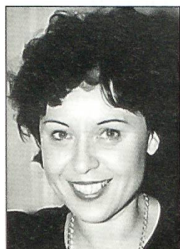
Von Tina Mäder, Wien

verantwortlich für die Führung aller ihm unterstellten Einsatzkräfte. Das Kommando ist truppendienstlich ein Teil der neu geschaffenen Streitkräftebasis, in der alle gemeinsamen Aufgaben von Heer, Luftwaffe und Marine wahrgenommen werden. Weil sich das Spektrum der Einsätze der Bundeswehr erweitert hat, war es notwendig geworden, diese Kommandostelle zu