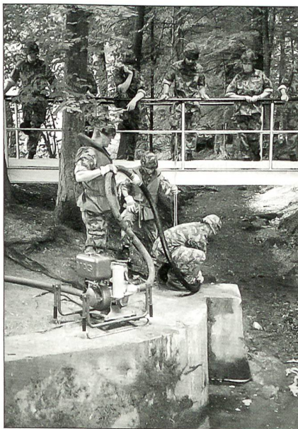
Auch beim Zusehen kann man lernen ...

Die Ausbildung zum Rettungssoldaten war sehr streng, aber auch sehr lehrreich.