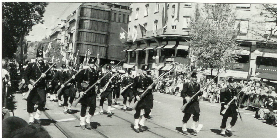
Der Zürcher 1.-August-Umzug zieht immer viel Publikum an. Die Compagnie 1861 in der Zürcher Bahnhofstrasse, dahinter eine Fahnenlegation.

Herr Bundesrat Schmid, wir wünschen Ihnen einen schönen 1. August in Zürich.