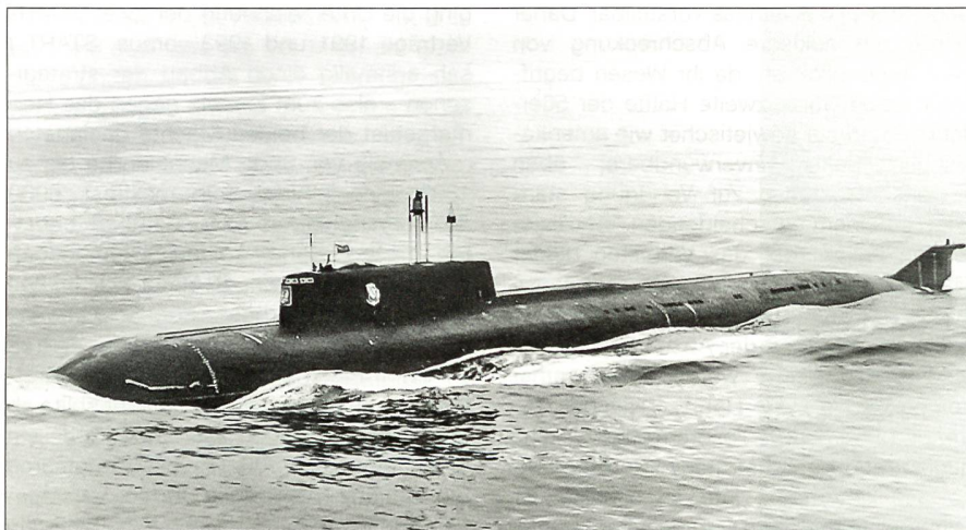
Die im August 2000 gesunkene «Kursk» war ein modernes atomgetriebenes Jagd-Unterwasserfahrzeug der russischen Flotte.

jetische Grossmachtrivalität, die sich am dramatischsten im hemmungslosen nuklearen Rüstungswettlauf manifestierte, nach heutiger Einschätzung der Dinge, der Vergangenheit angehört.