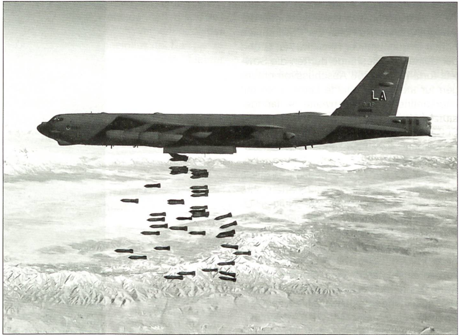
Strategischer Bomber B52: In Afghanistan und Irak konventionell eingesetzt, aber Bestandteil der nuklearen Streitmacht der USA.

Eingeschränkte strategische Handlungsfähigkeit der Supermacht Amerika wegen der Verstrickung in Vietnam, in die sie namentlich die demokratischen Administrationen Kennedy und Johnson, gewiss geleitet von hehren Absichten, doch als Ergebnis fragwürdiger strategischer Analyse, geführt hatten; Einsetzen der konsequenten Anstrengungen der neuen Administration Nixon, um die Lage generell unter Kontrolle zu bringen und, nicht allzu lange danach, die USA aus dem vietnamesischen Sumpf hinauszuführen (Waffenstillstand mit den Nordvietnamesen Anfang 1973); kühne diplomatische Initiativen dieser Regierung unter massgeblichem Einfluss von Henry Kissinger zur Herstellung normaler Beziehungen zum kommunistischen China, womit Moskaus Manövierraum eingeschränkt wurde, und zur Dämpfung des atomaren Wettrüstens