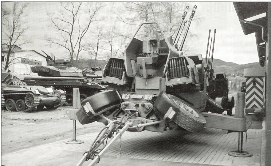
Prototyp Oerlikon 35-mm-Zwillings-Fliegerabwehrkanone GDF 005.

sprechend umgestaltet und zum schweizerischen Militärmuseum ausgebaut. Auf einstweilen gut 6000 m 2 entsteht eine Ausstellung über die Militärtechnik der Schweiz und des Auslandes aus der Zeit des zwanzigsten Jahrhunderts. Die Besucher werden nebst den bisher erwähnten Ausstellungsstücken die praktisch lückenlose Serie der Panzer der Schweizer Armee, daneben aber auch legendäre ausländische Waffen wie z. B. den russischen Panzer T34/85, eine deutsche 8.8 Flak 36 französische und englische Kleinpanzer bis zur deutschen Fernbombe V1 aus dem Jahr 1944 betrachten können. Neben der statischen Ausstellung werden an besonderen Tagen auch Exponate in Bewegung vorgeführt. In einem Panzer-Fahrsimulator können Museumsbesucher nach entsprechender Einführung selbst aktiv werden. Eine Cafeteria mit Blick in die Ausstellungshalle und ein Museumshop werden die Besucher zum Verweilen einladen.