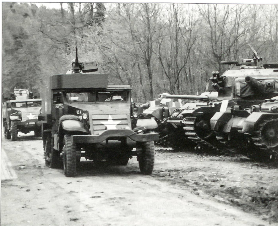
Voll funktionsfähige Panzerfahrzeuge, zwei amerikanische Halbkettenfahrzeuge «US Half-track» vor Schweizer Panzer.

Ende 2002 ergab sich eine einmalige Gelegenheit. Die Produktion in der imposanten Fabrikhalle der Chemie Uetikon AG in Full, welche unmittelbar bei der Wilhelm Miescher-Museumshalle steht, ist im vergangenen Jahr eingestellt worden. Dieses Gebäude mit seiner beeindruckenden Industriearchitektur, mit gut 57 000 m 3 Inhalt auf mehreren Stockwerken, wurde dem Museum zum Kauf angeboten. Dieser Kauf wurde nun an der diesjährigen, gut besuchten Generalversammlung einstimmig gutgeheissen. Nach Übernahme der Halle wird dieselbe ihrer neuen Verwendung ent-