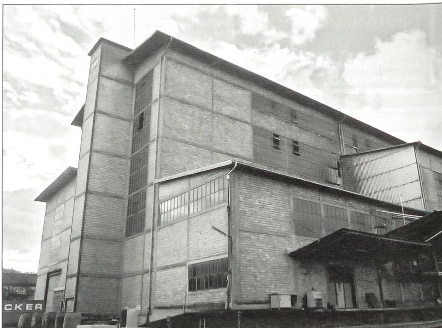
In dieser Halle in Full/AG eröffnet der Verein das Schweizer Militärmuseum SMM im Sommer 2004.

te Festungsmuseum fünfundzwanzig in der näheren Region gelegene militärische Anlagen aus der Zeit des Aktivdienstes käuflich erworben und in der Folge restauriert und wieder ausgerüstet. 1998 wurde eine Ausstellungshalle in Full eröffnet. Die nach dem ersten Kommandanten der Festung benannte Wilhelm Miescher-Museumshalle beherbergt eine umfangreiche Sammlung an Grossgeräten insbesondere aus der Zeit des zwanzigsten Jahrhunderts. Vom legendären Panzerwagen 1939 «Praga» bis zum Prototyp der Panzerkanone 68 wird dem Besucher ein lückenloser