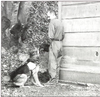
Der Hund gehorcht seinem Führer aufs Wort und unterstützt ihn bei seiner Arbeit.