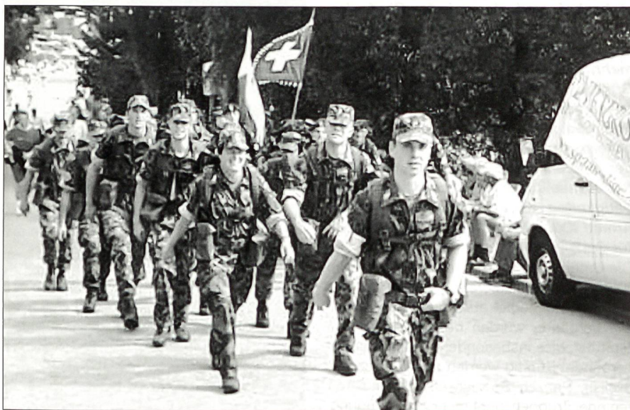
Trotz Blasen an den «Flossen» – keine Tränen vergossen!