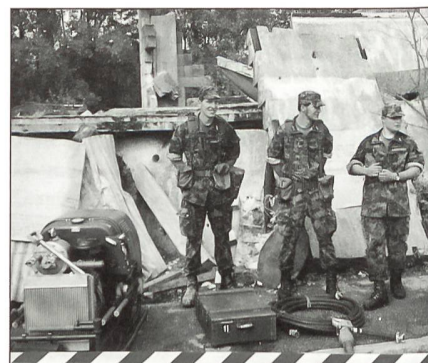
Rekruten beim Vorstellen ihrer Arbeitsplätze.

Punkt 14 Uhr eröffnete der Schulkommandant mit seiner Begrüssung den Besuchstag der Rettungs-Rekrutenschule 277. Zirka 1500 Eltern,