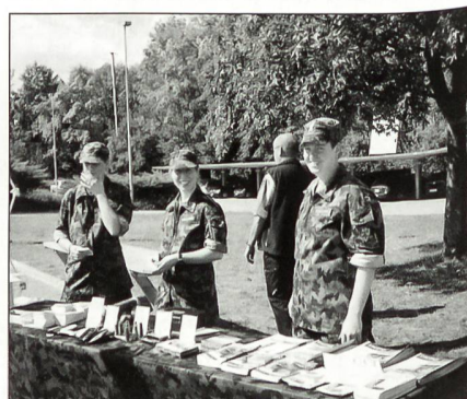
Frauen in der Armee bei der Werbung für ihre Sache.

Nach der Begrüssung durch den Schulkommandanten wurden wir ins Übungsdorf transportiert. Hier hatten wir Gelegenheit, das Erlernte der vergangenen RS-Wochen in einer eindrucklichen Demonstration kennen zu lernen. Vorerst wurden wir in die Ausgangslage eingeführt. Da die Rettungstruppen vor allem auch bei grösseren Katastrophen zum Einsatz kommen, war es nahe legend, uns einen Einsatz in Zusammenarbeit mit anderen Truppengattungen und zivilen Stellen vorzuführen. Die Übungsanlage bestand darin, dass ein Tankfahrzeug mit Anhänger in einen Verkehrsunfall geriet und dabei explodierte. Dieser Vorfall führte dazu, dass mehrere Gebäude in Brand gerieten und die Strassendurchfahrt blockiert wurde. Nach einer heftigen Explosion rückte als Erstes die zivile Feuerwehr an. Auf Grund weiterer Explosionen, die auch zu Hauseinstürzen führten,