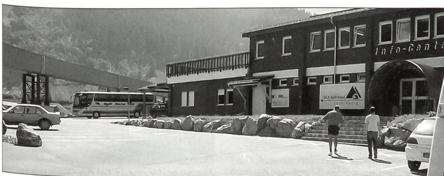
Infozentrum der NEAT-Baustelle «Mitholz» im Kandertal, Berner Oberland.

Nachdem alle wieder im «Dysli-Car» Platz genommen hatten, ging die Fahrt weiter über Adelboden zum Restaurant «Geils-Brüggli». Da ein