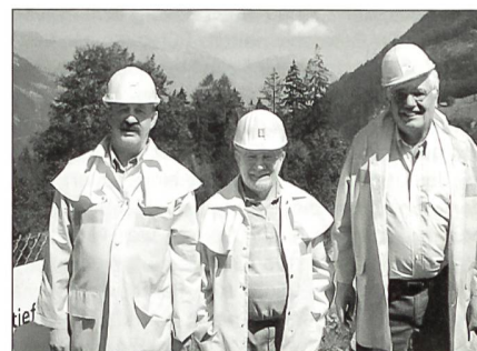
Alle Besucher wurden mit einer Schutzkleidung ausgerüstet.

Im Anschluss an diese interessante Information ging es in die Unterwelt, um das Gehörte und im Film vorgetragene an Ort und Stelle, das heisst möglichst live zu erleben. Vorerst wurden wir, wie es sich bei einem solchen Baustellenbesuch gehört, mit Helm und Schutzkleidung ausgerüstet. In Gruppen aufgeteilt, ging es danach mit Shuttlebussen in den Untergrund. Dass die Tunnelarbeiter bei viel Staub und recht hohen Temperaturen arbeiten müssen konnten wir live erleben. Einige Kameraden kamen recht ins Schwitzen. Auch der vorhandene dauernde Lärm darf nicht unterschätzt werden. Die Luft muss laufend umgewälzt bzw. erneuert werden, was den ständigen Betrieb einer ausreichenden Ventilation bedingt. Der Ausbruch des Felsmaterials bedingt einen Abtransport des Materials einerseits durch Förderbänder oder Transportfahrzeuge, die ebenfalls wieder einen recht grossen Lärm verursachen. In rund 1000 m unter Boden verliessen wir die Fahrzeuge, um per Fussmarsch einige interessante Arbeitsstellen