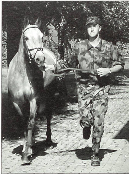
Mensch und Pferd als Einheit – Arbeiten auf dem einen der beiden Pferdestellplätze (Ibach) des Mob PI 317 im WK 2000.

Der Mob PI 317 und seine Wehrmänner haben mit ihren Dienstleistungen genau dem nachgelebt. Als Milizverband hat er während mehr als 30 Jahren die Vorbereitungen zur Organisation von über 100 Stäben und Verbänden mit insgesamt über 10 000 Mann vorwiegend im Raum des geschichtsträchtigen Kantons Schwyz geplant, eingeübt und ausgetestet. Das neue System der abgestuften Bereitschaft ist noch nicht fertig und hat sich noch nicht bewährt. Es erfordert intensive Ausbildung und viele Feinarbeiten. Nicht nur dieser Prozess bedarf unserer Unterstützung,