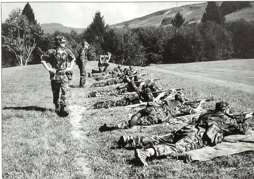
Eine Installationsgruppe des Mobilmachungsabschnitts 317.1 bei der infanteristischen Grundausbildung im WK 2000 auf dem Schiessplatz Rothenthurm-Altmett.

Stellvertretend für die Wehrmänner des Mobilmachungsplatzes 317 danke ich Ihnen, dass Sie unserer Einladung zur letzten Standartenabgabe unseres Verbandes gefolgt sind. Unser heutiges Zusammenkommen ist eine erinnerungsträchtige Begegnung, von Volk und Soldaten, eine