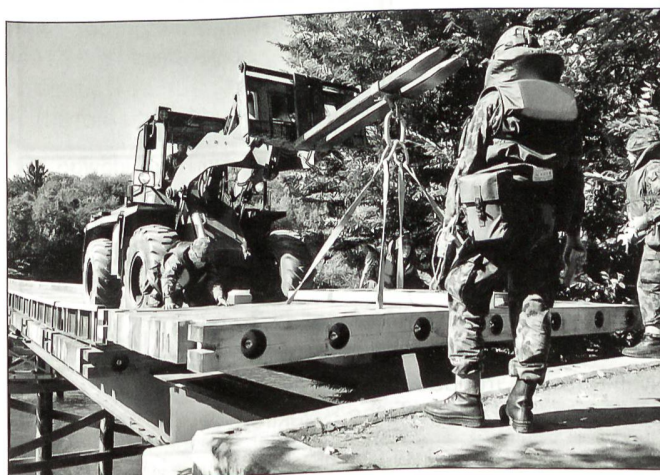
Klare Kommandos sind beim Einbau der Schwimmbrücke 95 nötig.

Mit dem Fahnenmarsch, gespielt vom Spiel der Panzerbrigade 4, wurden die Feldzeichen des G Rgt 2 für immer abgegeben. ✚