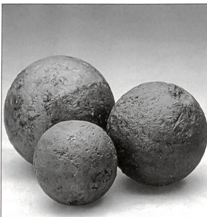
Kanonenkugeln aus der Kriegszeit 1799, Raum Schaaenwald.

Im Sommer 1799 bekam Frankreich allmählich wieder die Oberhand auf dem europäischen Kriegsschauplatz. Die unter Erzherzog Karls Befehl stehenden Österreicher wurden nach Deutschland zurückbeordert, und an ihre Stelle traten die verbündeten Russen unter dem Kommando von General Korsakow. Dieser wurde am 25./26. September 1799 in der Schlacht von Zürich durch den französischen General Massena geschlagen. Nach ihrem plündernden Rückzug bis an den Rhein waren die Russen aber nicht gewillt, sich ans nördliche Rheinufer zurückzuziehen und waren bereit, auch den Brückenkopf bei Büsingen tapfer zu verteidigen. Die NZZ vom 16. Oktober 1799 schreibt dazu: «7. Oktober: ... die Russen haben beim Kloster Paradies Batterien (Artillerie) errichtet, um den Brückenkopf im Schaaenwald zu verteidigen.» Korsakow entschloss sich, mit rund 20 000 Mann ein letztes Mal die vorrückenden Franzosen im Raume Schlatt, Trüllikon, Benken und Rudolfingen zu bekämpfen. Korsakow musste sich jedoch geschlagen geben und endgültig hinter den Brückenkopf zurückziehen. Zur Sicherung ihres Rückzuges brannten sie