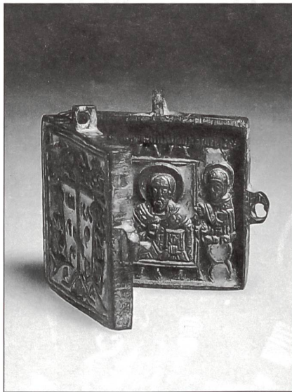
Russische Ikone, Fund aus der Schanze Schaarenwald 1799 (Foto: Kantonales Amt für Archäologie, Frauenfeld).

Im Frühjahr 1800 entschloss sich Frankreich, mit rund 100 000 Mann unter General Moreau über den Rhein Richtung Norden stossend in den süddeutschen Raum einzudringen und die Österreicher zu einem Frieden zu zwingen. Rund 35 000 Mann sollten unter dem Befehl von General Lecourbe über den ehemaligen Brückenkopf im Schaarenwald ans nördliche Rheinufer gelangen. Die immer noch in Büsingen festgekrallten Österreicher zwangen ihn jedoch zu einem Täuschungsmanöver: Mit wenigen Truppen machte er den Feind glauben, der Hauptangriff erfolge wiederum aus dem