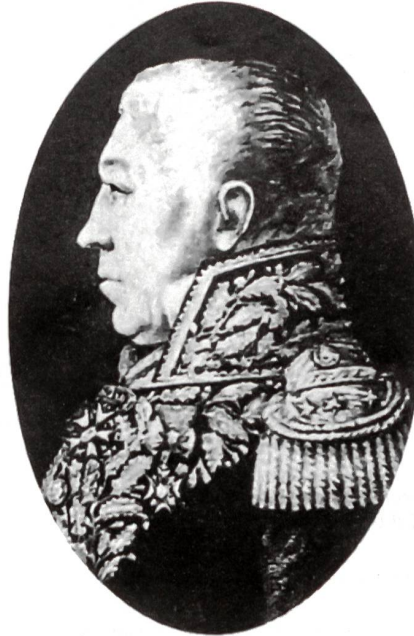
Der französische Artillerie-Brigadegeneral François Louis Dedon (1765–1810), Kommandant des Brückenschlages von Rheinklingen am 1. Mai 1800.

Während der Kriegswirren wurden die Rheinbrücken von Konstanz, Stein am Rhein, Diessenhofen und Schaffhausen fast allesamt zerstört (davon einige zeitweise behelfsmässig wieder repariert). Am 25. März 1799 setzten sich die Franzosen nach ihrer Niederlage bei Stockach (nörd-