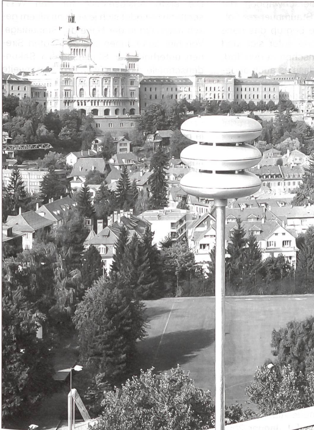
Die rund 7750 Sirenen werden jährlich getestet.

In der Regel erfolgt der Auftrag zur Auslösung des Alarmierungszeichens durch die NAZ, einen Bereich des BABS. Sie ist die Fachstelle des Bundes für ausserordentliche Ereignisse. Dazu gehört in erster Linie die Gefährdung durch erhöhte Radioaktivität, sei dies im Falle eines Kernkraftwerk-, eines Labor- oder auch eines Transportunfalles. Weiter zählen aber auch grosse Chemieunfälle, Staudammbrüche und Gefährdung infolge Satellitenabsturz zum Aufgabenbereich.