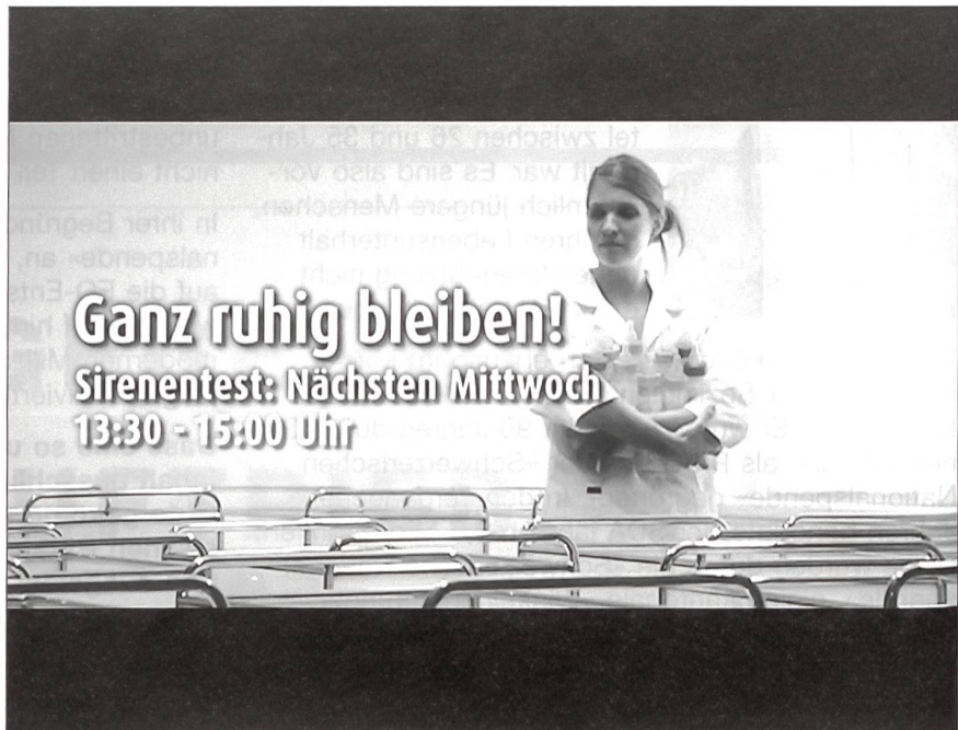
Zur Information der Bevölkerung über das richtige Verhalten bei einer Gefährdung hat das Bundesamt für Bevölkerungsschutz drei neue Fernsehspots produziert.

Die neue Alarmierungsverordnung beinhaltet dabei eine Vereinfachung: Seit Anfang 2004 wird die Bevölkerung grundsätzlich mit dem Zeichen «Allgemeiner Alarm» alarmiert;