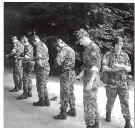
Vorbereitung für den Feueereinsatz.

Mit der Einführung der Neuen Gefechtschiesstechnik in der Schweizer Armee wurde die Schiessausbildung der Soldaten revolutioniert. Die Technik basiert auf folgenden Grundsätzen: • Einfachheit und Anpassungsfähigkeit, Waffenunabhängigkeit für Manipulationen, Schiesspositionen und Störungsbehebung