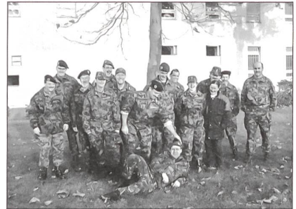
Schweizer Delegation mit einem Kameraden aus Holland (vorne).

Die Schweizer Delegation startete am Freitagmorgen ab Bern mit zwei Kleinbussen Richtung Köln. Nach einigen Problemen, ein Beifahrer hatte im Raum Köln einige Schwierigkeiten mit der Strassenkarte, trafen sie doch noch wohlbehalten in der Kaserne ein. Nach dem Bezug der Unterkunft knüpften die Schweizer an der Bar die ersten Kontakte mit den Kameraden aus Polen und Holland. Besonders gut verstanden sie sich