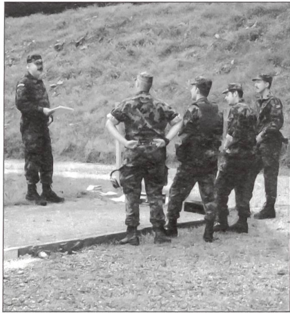
Orientierung der Gruppe über den bevorstehenden Auftrag.