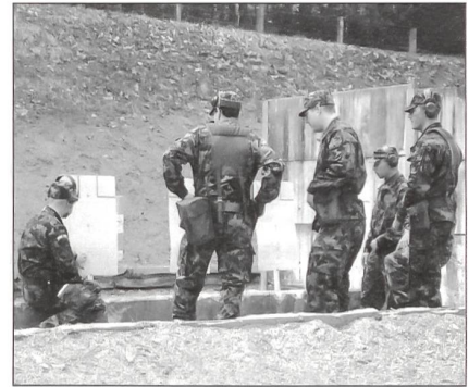
Besprechung der Zielvorgabe.

Wo ist nun aber die Verbindung zwischen einem schon lange verstorbenen chinesischen Philo-