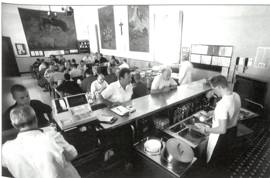
Verpflegung in der Kantine.

Die Bedeutung der Verpflegung hat die Garde offenkundig begriffen, denn was hier auf die Sechser- und Vierertische gelangt, lässt keine Wünsche offen. Das Ver-