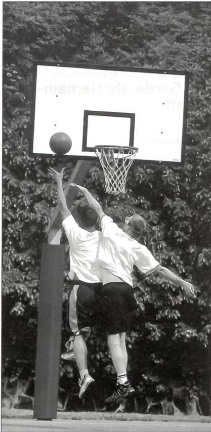
Sportliche Beteiligung in der Freizeit.

dienst hierfür kommt den Köchinnen zu, Schwestern der Kongregation von der Göttlichen Vorsehung Baldegg, die in der Küche walten und aufopfernd für das leibliche Wohl der jungen Männer sorgen.